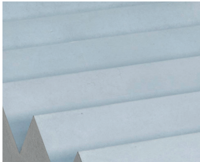
Blasoco BWE 30